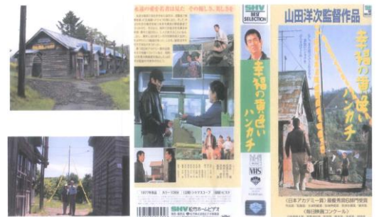
平成28年6月30日(木)快晴