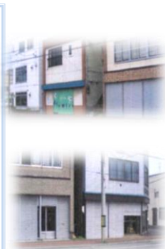
NHKマツサンのロケ地(余市)

近年「T」が普及し、海外の観光客が増えた映画のロケ地目当ての観光客も少なくないシャッターを開けた店の若者の顔が見たい大自然と地元を若者感覚で活かして欲しい